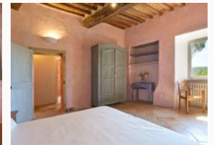
Einblick in die Zimmer